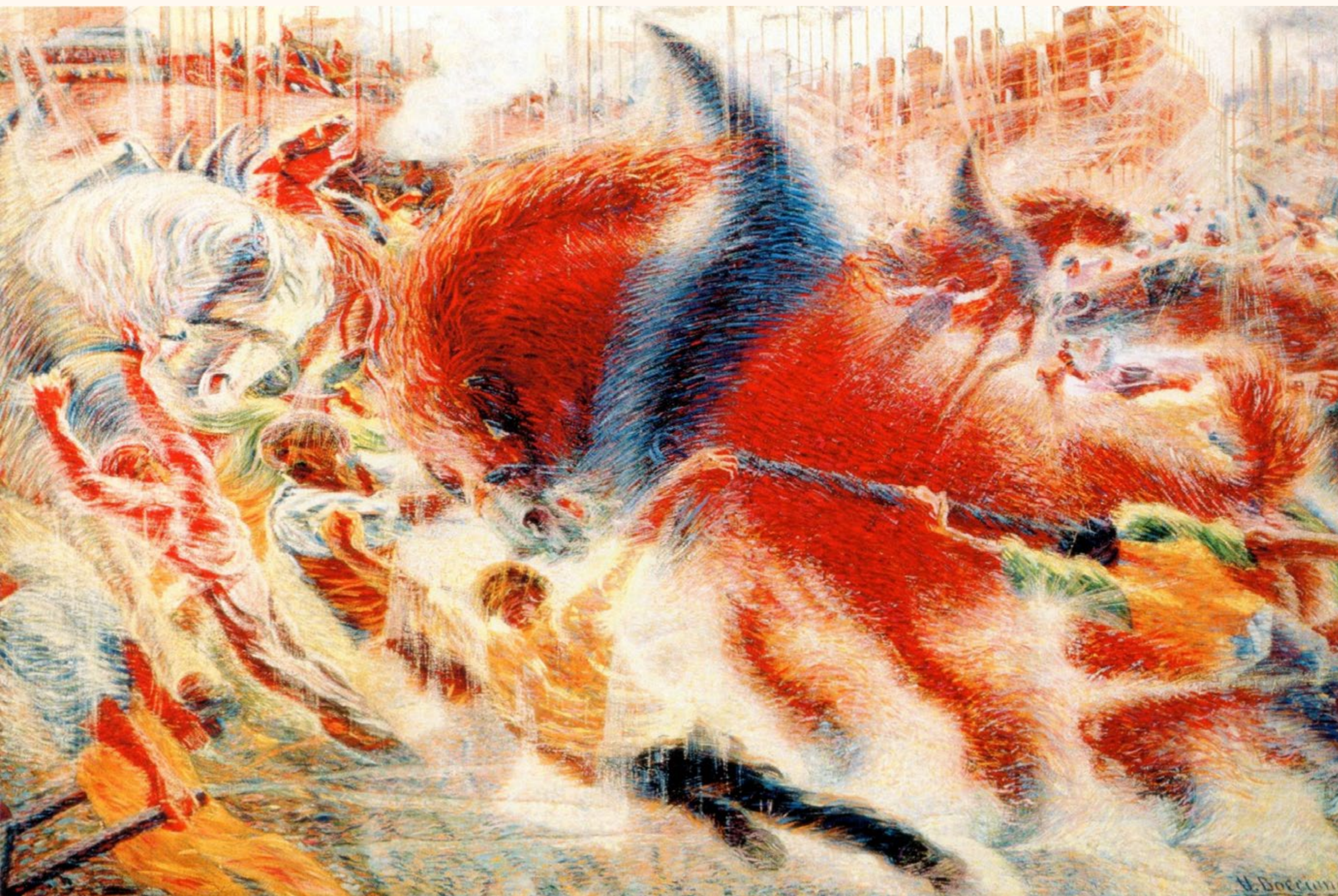
La ville se lève, 1910

Umberto Boccioni est l'un des signataires du manifeste de la peinture futuriste en 1910. Il a étudié la peinture avec les impressionnistes puis le divisionnisme. Il travaille aussi comme illustrateur