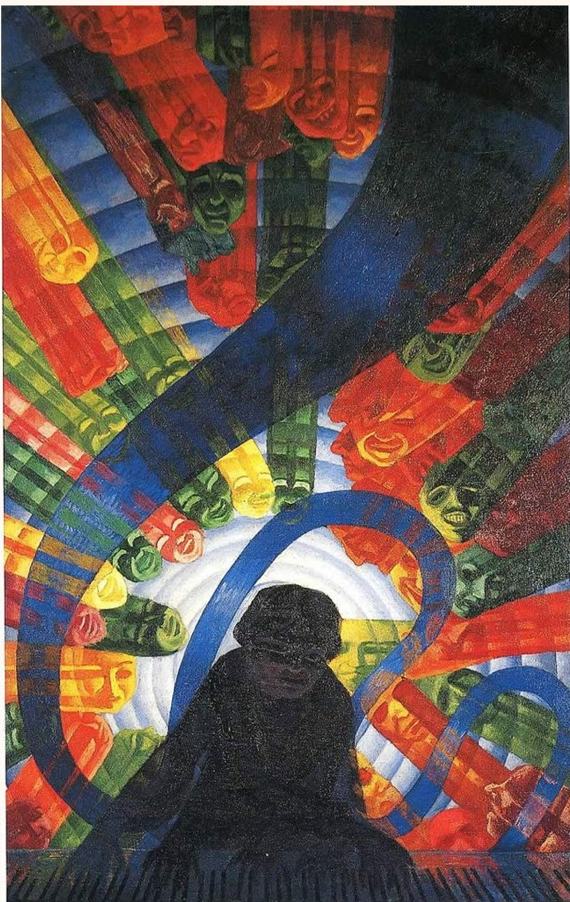
La musique, Luigi Russolo, 1911