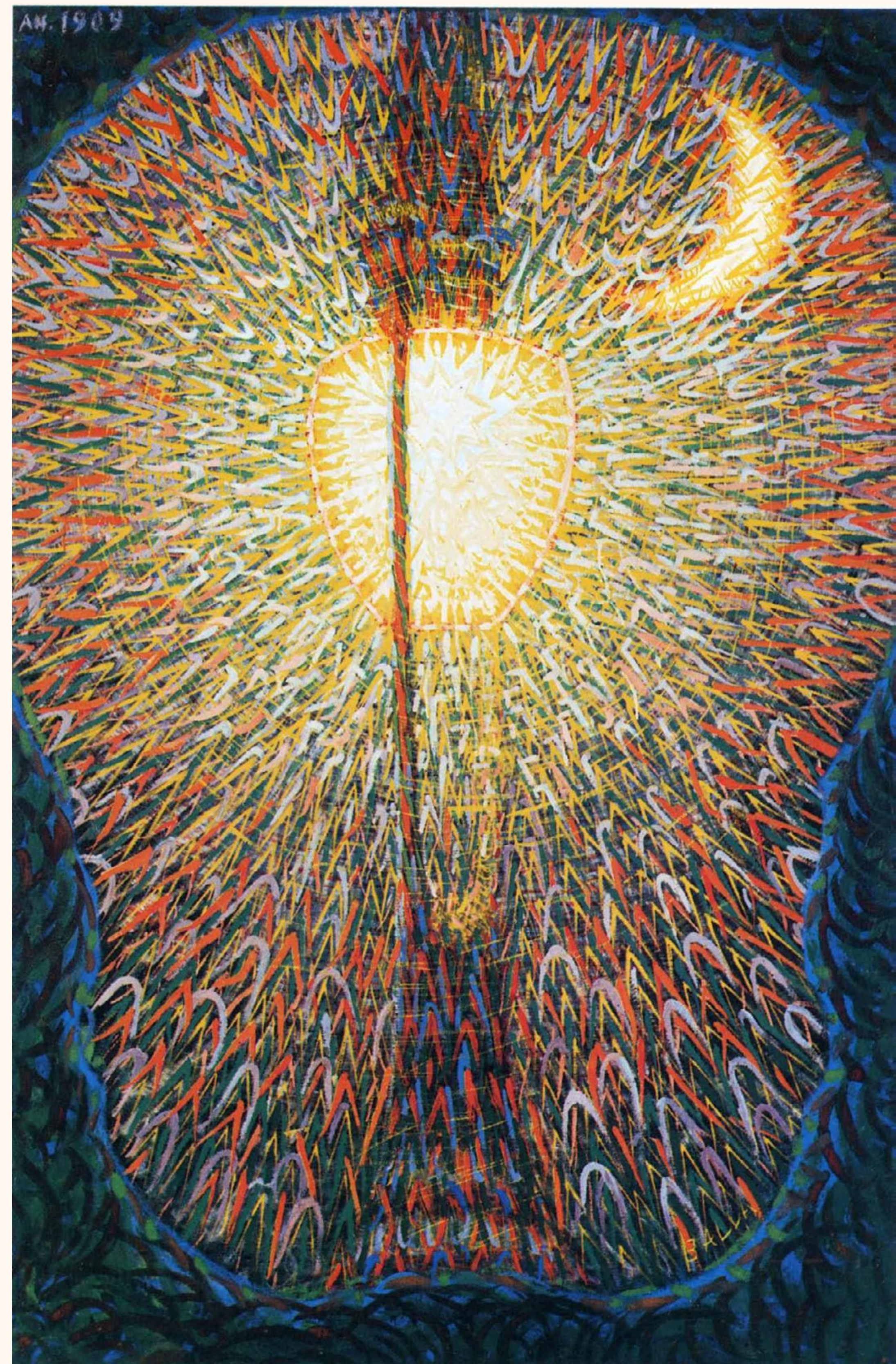
Lampe à Arc, 1910