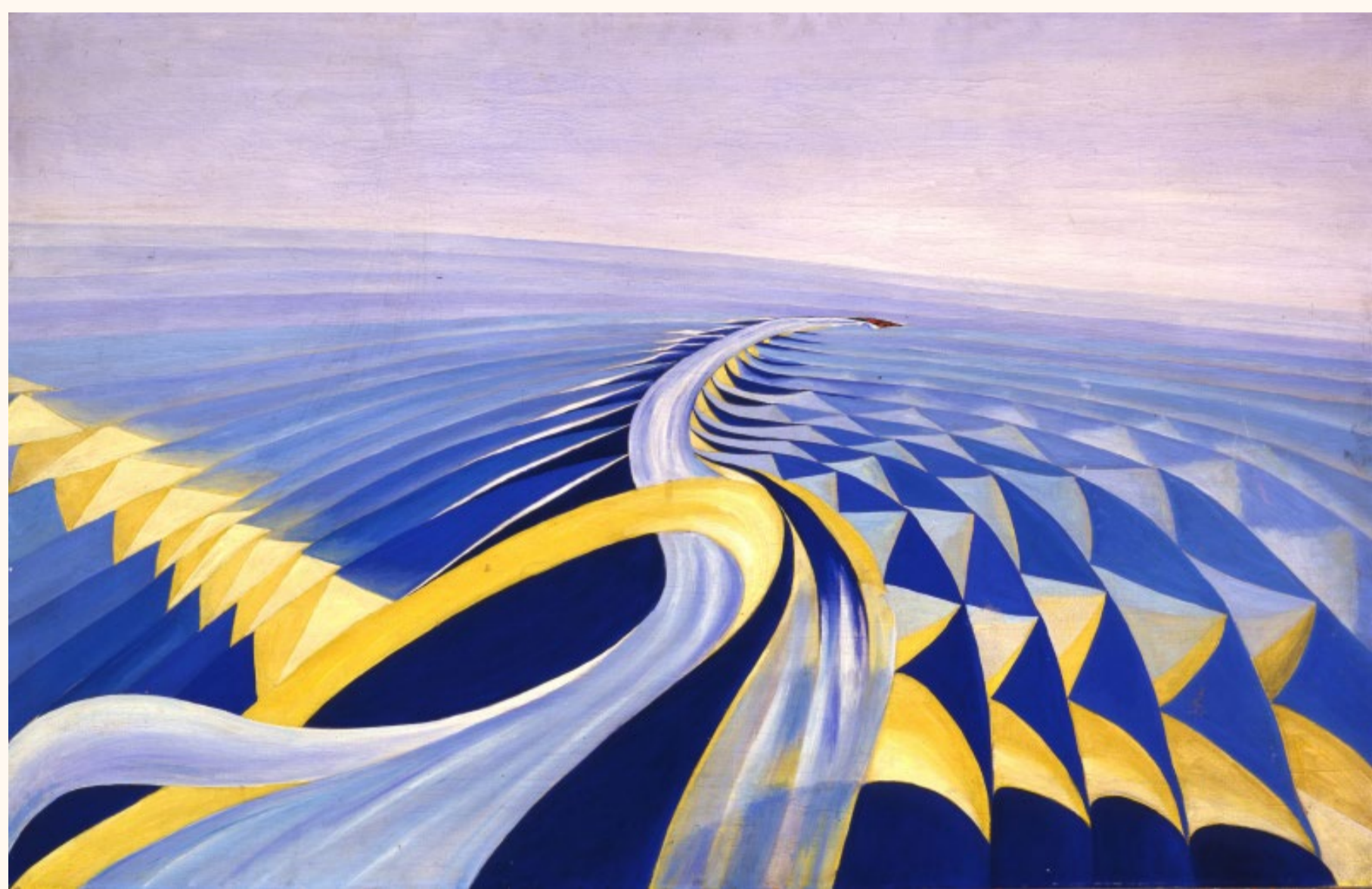
Velocità di motoscafo, 1919-1924

Lors de vacances à la mer elle crée, avec son mari Marinetti, le tactilisme, une sorte d'évolution multi-sensorielle du futurisme.