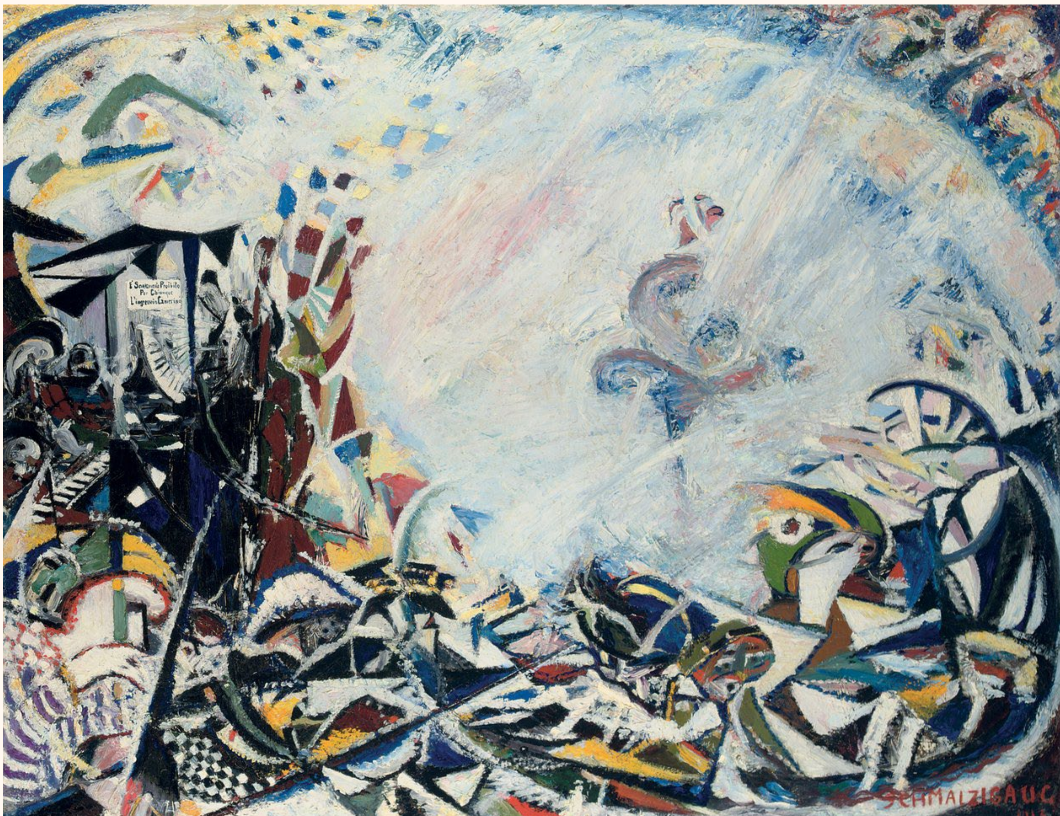
Le dynamisme de la danse - Jules Schmalzigaug - 1913