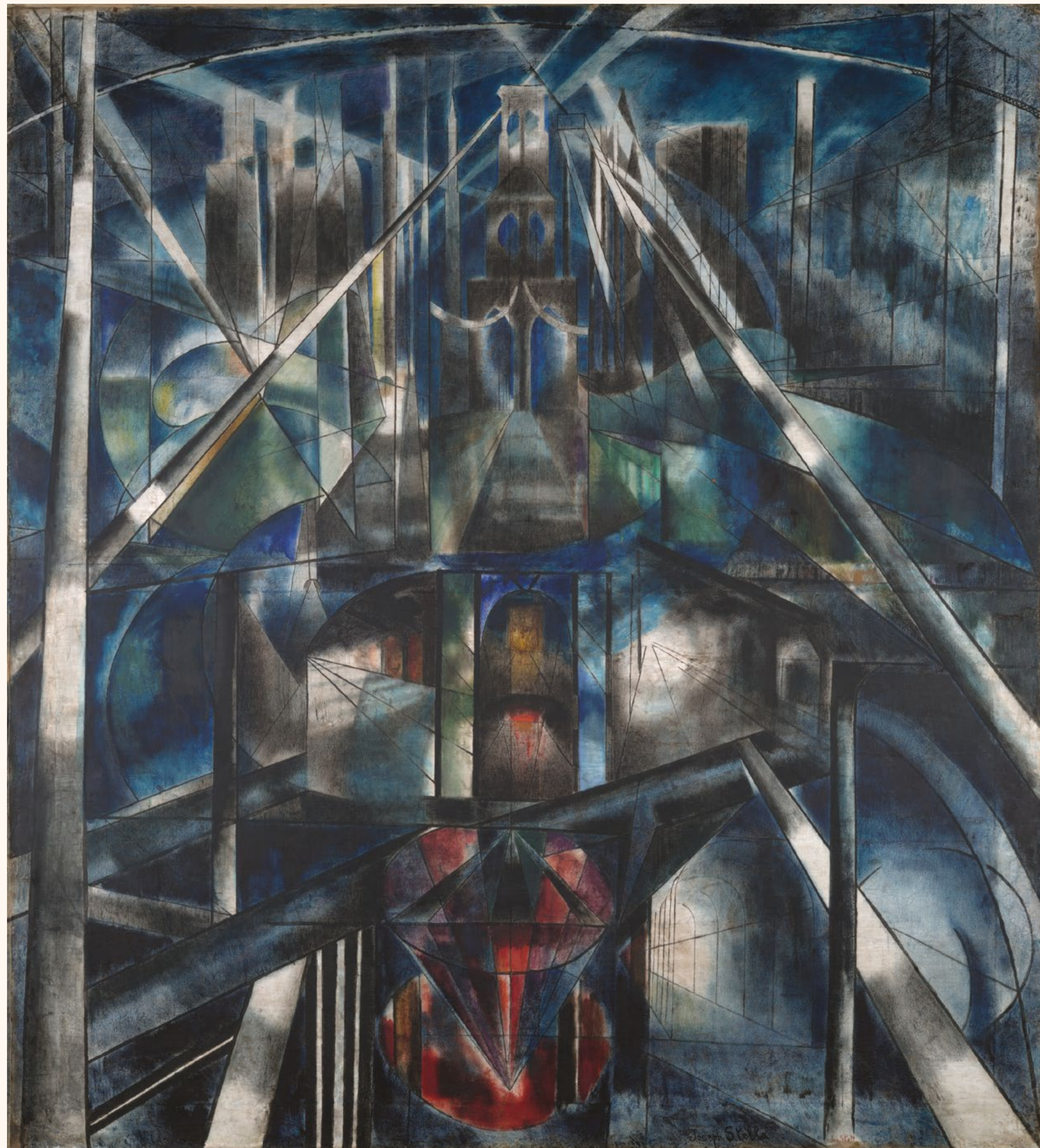
Brooklyn Bridge, Joseph Stella, 1919