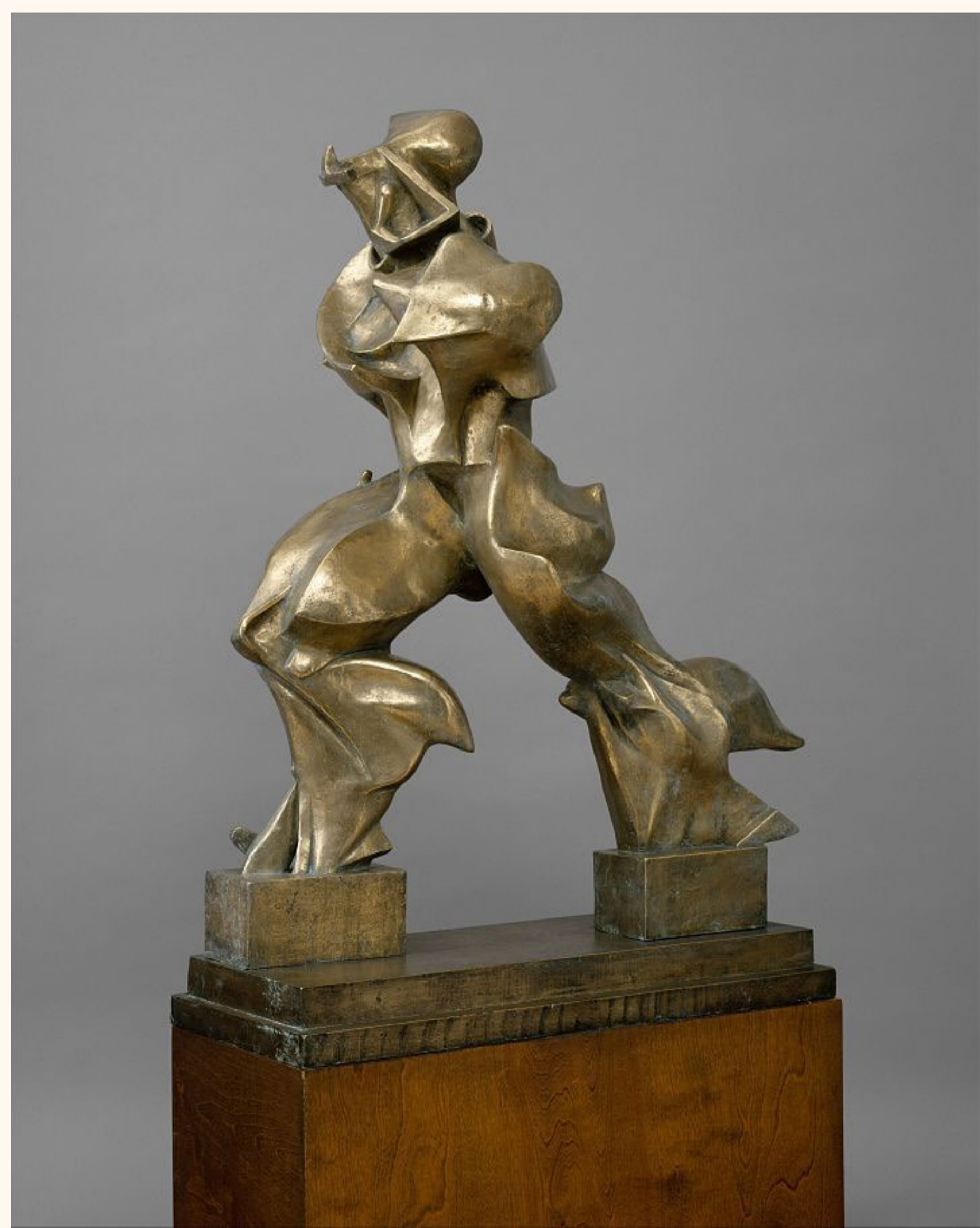
L'homme en mouvement, 1913

Sa sculpture de l'homme en mouvement est considérée comme son chef d'oeuvre.