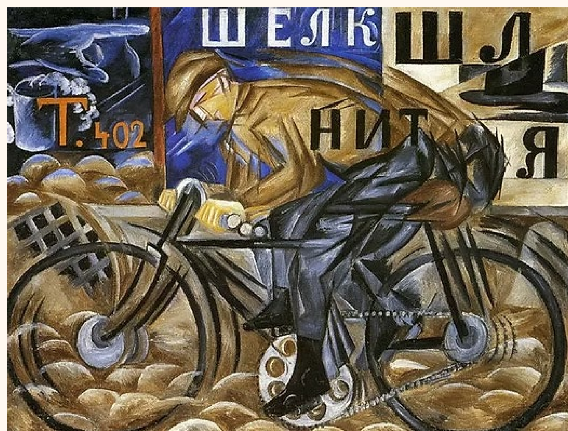
Natalia Gontcharova, Le Cycliste, 1913.

Le futurisme prône la vitesse, la modernité, l'usine, les villes et les machines. On rejette les sujets traditionnels et on met en avant le dynamisme et le mouvement.